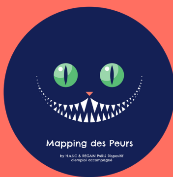
MAPPING DES PEURS SENSIBILISATION AU HANDICAP PSYCHIQUE