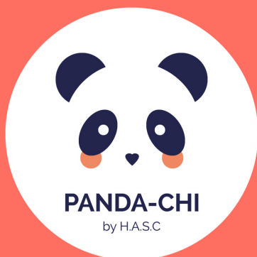
PANDA-CHI GAME! SENSIBILISATION AU HANDICAP INVISIBLE

DES CONCEPTS DÉVELOPPÉS DE A À Z PAR NOS SOINS!