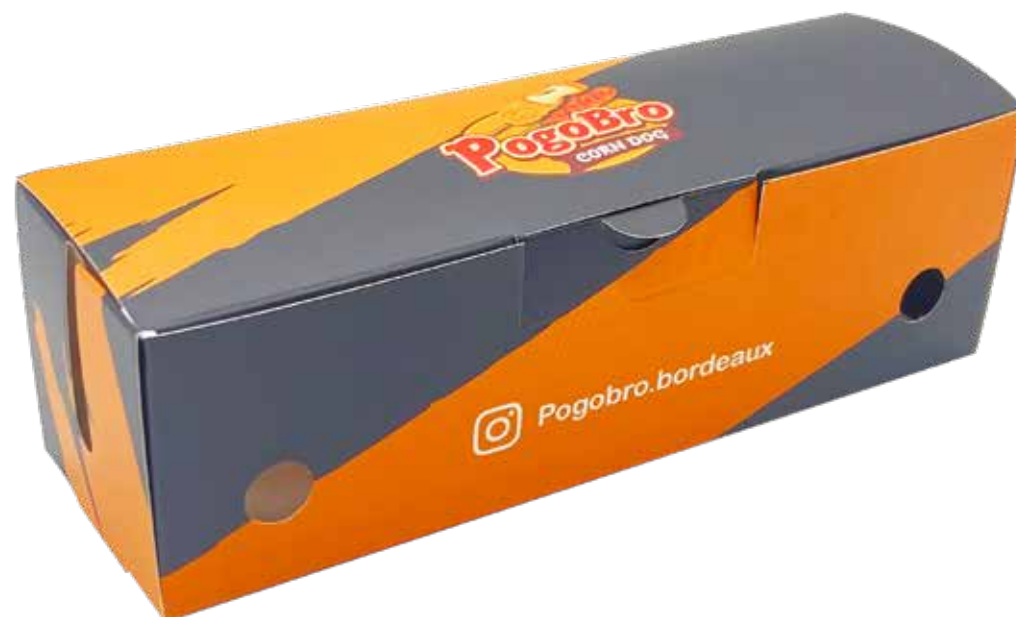
Boîte à Corn-dog Personnalisé pour PogoBro