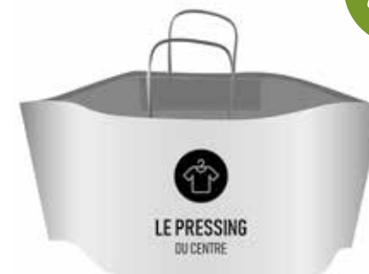
Sac Cabas poignées torsadées sans soufflets