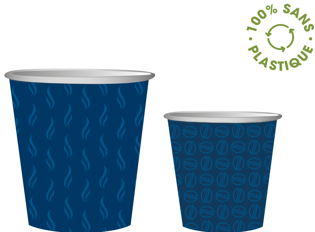
Gobelets Boissons Chaudes et Froides Sans Plastique Personnalisable