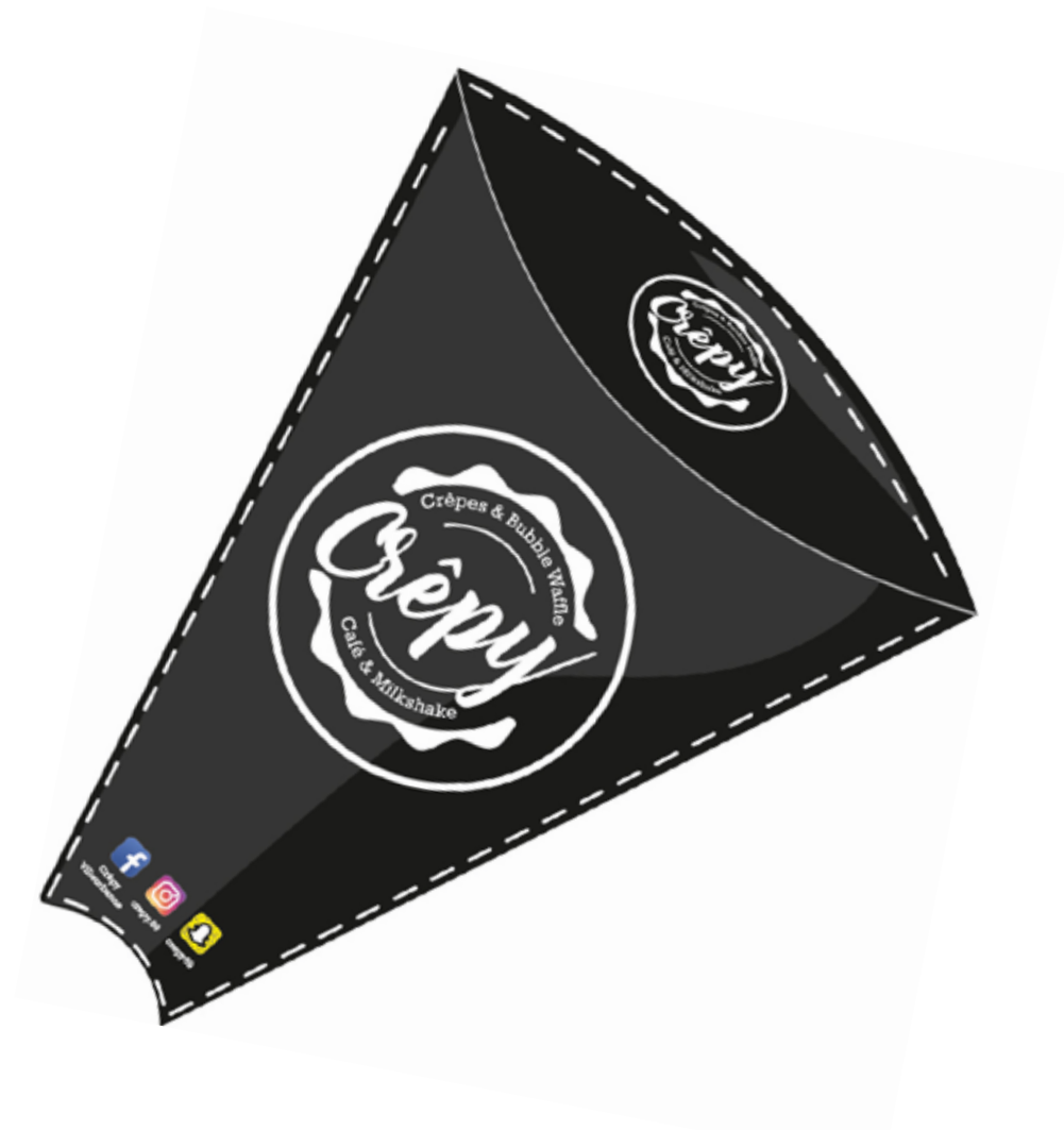
Étui à Crêpe Personnalisé pour Crêpy