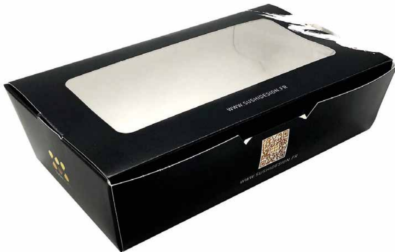
Boîte à Sushi Personnalisé pour Sushi Design