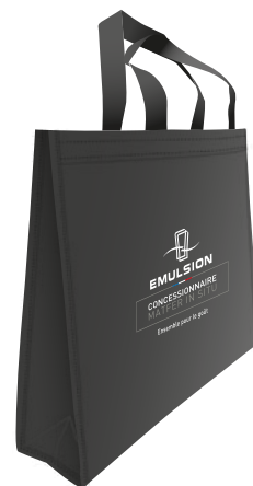
Sac Non Tissé

💧 Impression : Offset / Quadri couleurs avec possibilité d'imprimer en Pantone (à préciser)