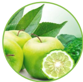
Pomme - bergamote