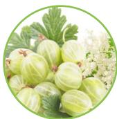
Groseille à maquereau - fleurs du sureau