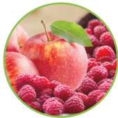
Pomme - framboises