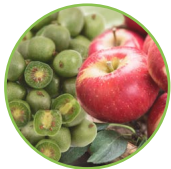
Pomme - kiwai