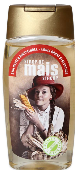
Maïs – 330 g