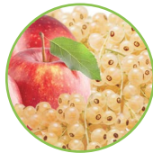
Pomme - groseilles blanches