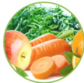
Pomme - carotte - orange