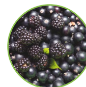
Mûres - cassis