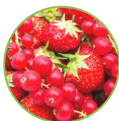
Fraise - groseilles rouges