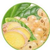
Groseille blanche et gingembre