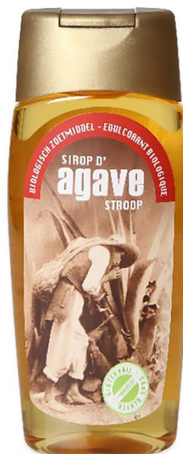
Agave – 330 g