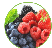
Fruits de bois