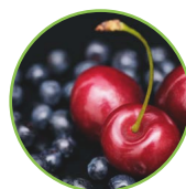
Myrtilles - cerises