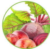
Pomme - betterave rouge