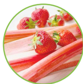
Rhubarbe - fraise