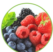
Fruits de bois