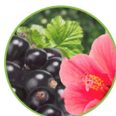
Cassis et hibiscus