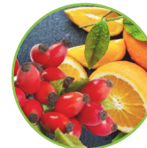
Églantine - orange