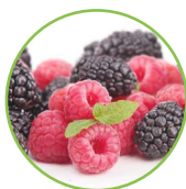
Framboises - mûres