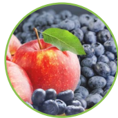
Pomme - myrtilles