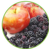
Pomme - mûres