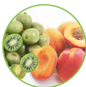
Kiwai - abricot