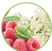
Framboise et fleurs de sureau