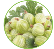
Groseille à maquereau