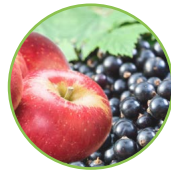
Pomme - cassis