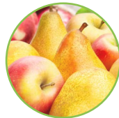
Pomme - poire