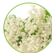
Fleurs du sureau