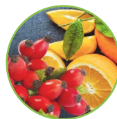
Églantine - orange