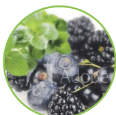
Fruits de bois et menthe