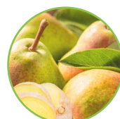
Poire - gingembre