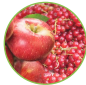
Pomme - groseilles rouges