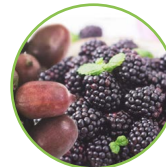
Kiwi rouge - mûres