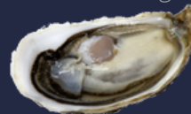
Spéciale - Speciale

-> indice de chair - verhouding schelp vlees > 10,5 %