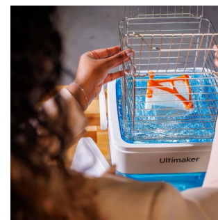
PVA Removal Station Retirez le matériau de support PVA hydrosoluble jusqu'à 4 fois plus rapidement