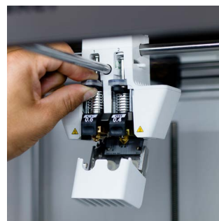
Print core CC À pointe de rubis pour l'impression de composites abrasifs de fibres de carbone et de verre. Disponible en 0,4 et 0,6 mm