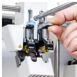
Print core BB Buses à permutation rapide pour matériaux de support hydrosolubles et de fabrication. Disponibles en 0,25, 0,4 et 0,8 mm