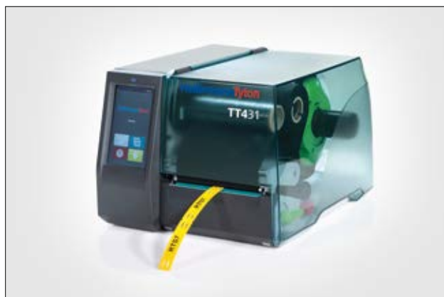
Imprimante par transfert thermique TT431 simple d'utilisation.