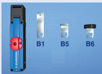
Actionneurs pour toutes les situations de montage

Solutions pour les applications les plus diverses