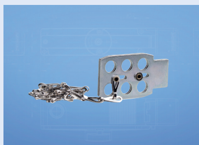
Dispositif de consignation SZ150-1

Empêche la fermeture accidentelle des dispositifs de protection par exemple lors de travaux de montage