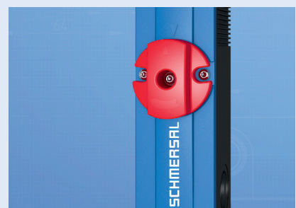
Déverrouillage manuel, de secours ou d'urgence

Empêche la fermeture accidentelle des dispositifs de protection par exemple lors de travaux de montage