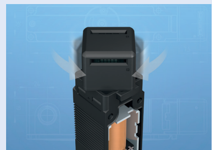
Tête d'actionnement orientable sans démontage