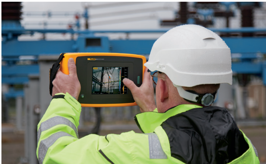
Image prise avec la caméra acoustique de précision ii910 qui détecte une décharge partielle dans une application haute tension.