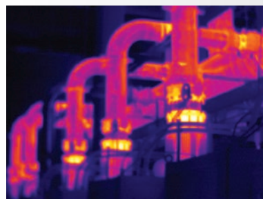
Mise au point manuelle

Une mise au point parfaite pour chaque objet. De près comme de loin. Mise au point MultiSharp™