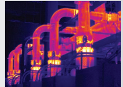
Mise au point MultiSharp