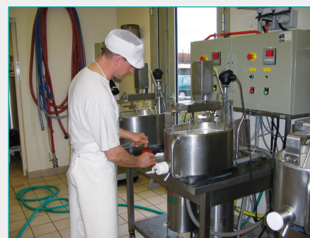
Minifromagerie expérimentale.

• Centre Marcel Maget (MSH Dijon) : archive des enquêtes des chercheurs en sciences sociales sur les mondes ruraux