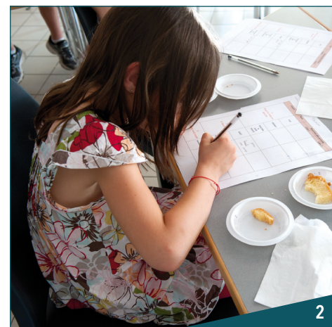
Le suivi jusqu'à l'âge de 8 ans permettra de mieux comprendre le rôle des interactions parents-enfants dans la mise en place des préférences et comportements alimentaires.