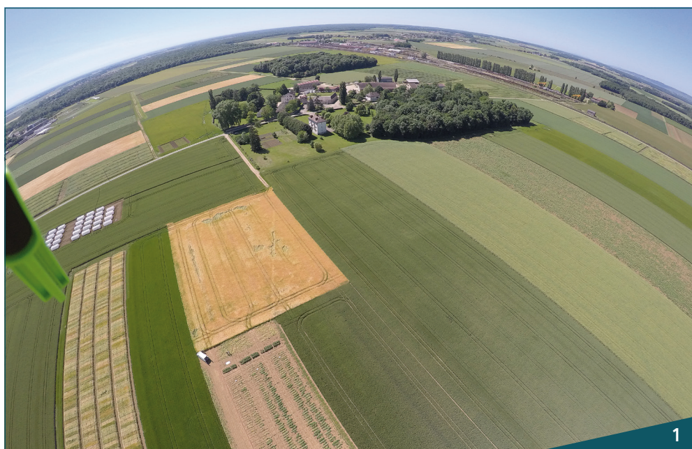
Depuis 2018, les 120 ha de l'UE Domaine d'Époisses deviennent une plateforme de recherche et d'expérimentation collaborative associant l'UMR Agroécologie.

3 ÉCONOMIE ET SOCIOLOGIE DU DÉVELOPPEMENT DES TERRITOIRES RURAUX ET PÉRI-URBAINS