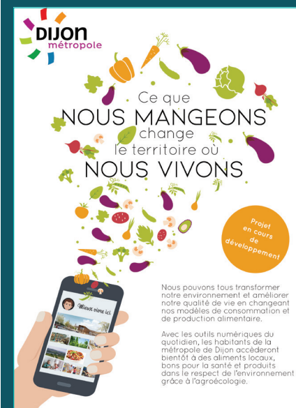
Affiche : « Ce que nous mangeons change le territoire où nous vivons »

Lauréat de l'appel à projets «Territoires d'Innovation» en 2019, Dijon Métropole a l'ambition de devenir d'ici à 10 ans le territoire démonstrateur d'un système alimentaire durable servant de modèle aux métropoles nationales et internationales. Le principe fondateur du projet repose sur une boucle vertueuse où le « Mieux manger » promeut le « Mieux produire » et où le « Mieux produire » permet le « Mieux manger ».