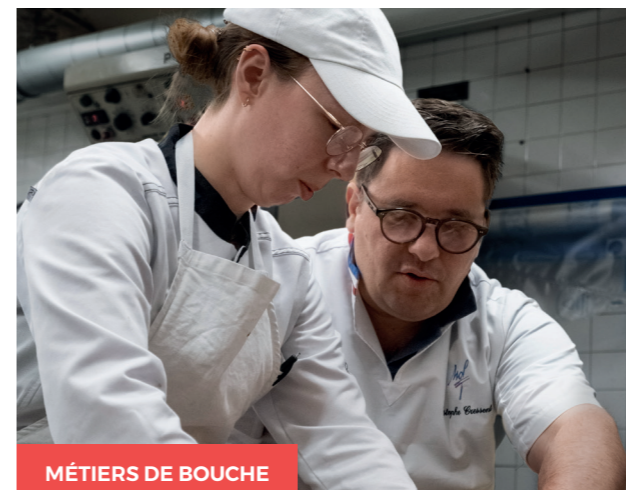
MÉTIER DE BOUCHE

Ce concentré de « mises à jour » est animé par des professionnels reconnus dans leur domaine pour assurer la transmission des bons gestes, des bonnes pratiques et des astuces entre pros.