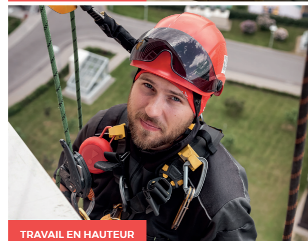
TRAVAIL EN HAUTEUR