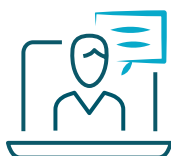
Formations en direct