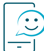
Réseaux sociaux internes