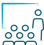
Séminaires & événements