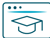
Vidéos d'auto formation