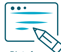
Plateformes d'adoption digitale (DAP)