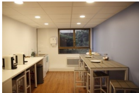
Cuisine Accès interdit actuellement