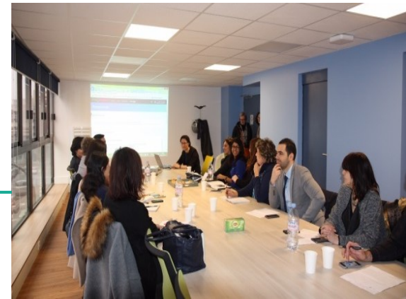
15/20 personnes assises /30 debout 10 actuellement