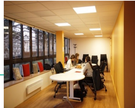
15/20 personnes assises /30 debout 10 actuellement