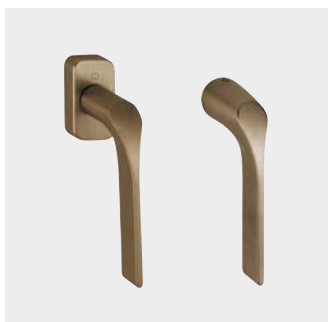
Poignées de fenêtre