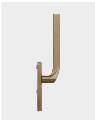
Poignées pour coulissant/levant