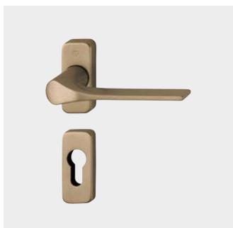
Poignées pour porte à profil