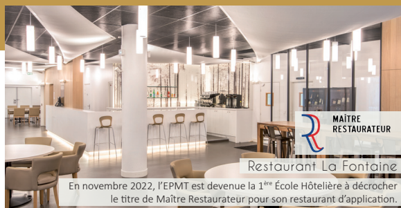
Restaurant La Fontaine

En novembre 2022, l'EPMT est devenue la 1 ère École Hôtelière à décrocher le titre de Maître Restaurateur pour son restaurant d'application.