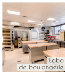
Labo de boulangerie