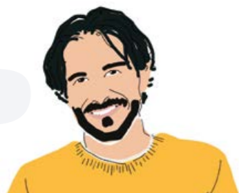
Créateur & Repreneur

→ Vous avez accès aux services exclusifs de l'association GSC : Fonds Social, assistance-emploi Mutuaide, rachat des points retraite pour les mandataires sociaux, etc.