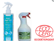
Détergents et désinfectants