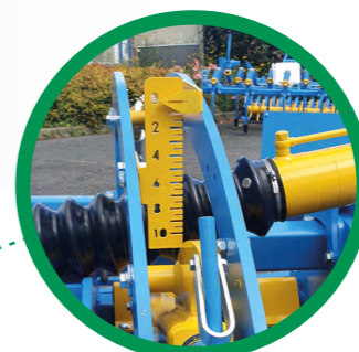
VISUEL DE PROFONDEUR PAR RÉGLETTE