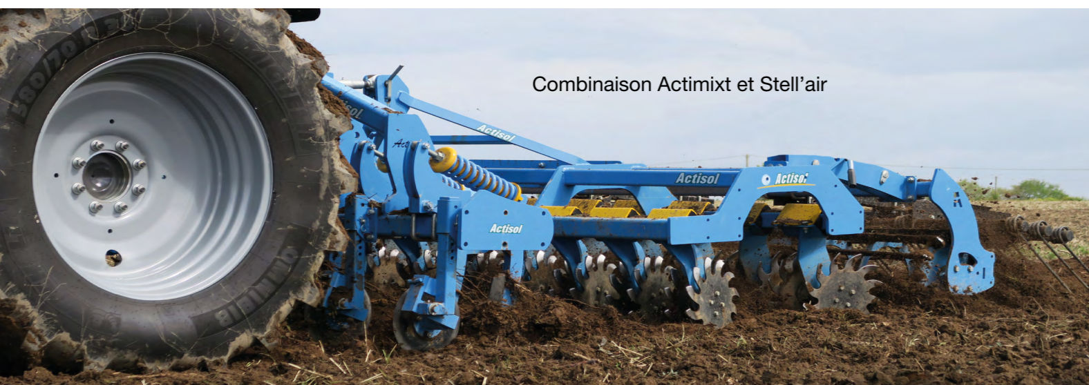
Combinaison Actimixt et Stell'air