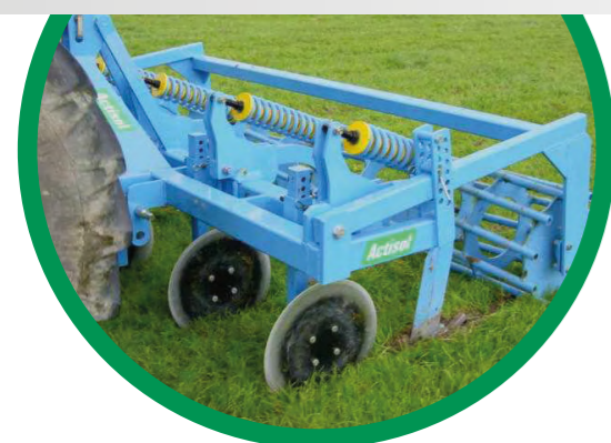
RÉGLAGE HYDRAULIQUE DE LA PROFONDEUR DE TRAVAIL