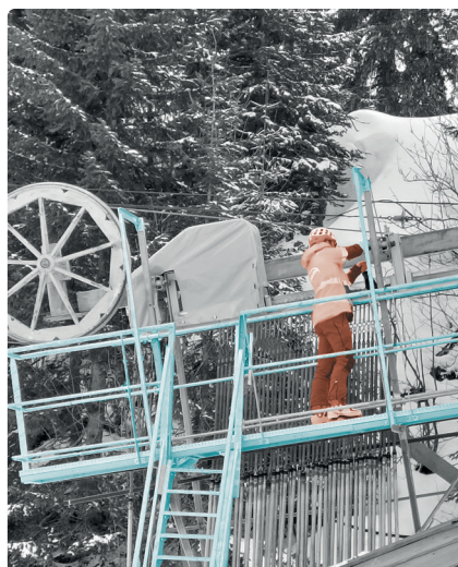
Mise en service des moyens d'accès et passerelles, d'un TK en STATION DE SKI .