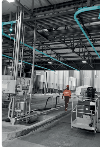
Mise en service de 7 LDV antichute, sécurisant les camions citernes chez un INDUSTRIEL LAITIER .