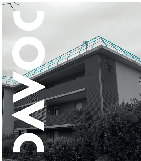
Réception des garde corps thermolaqués sur les toitures terrasses d'un BAILLEUR SOCIAL .

Vous accompagner, pour les actions correctives nécessaires, avec notre mission de DIAGNOSTIC et CONSEIL .