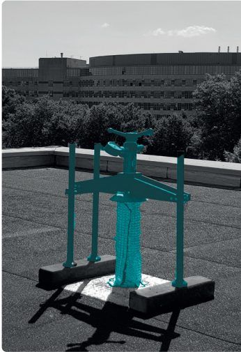
Test, non destructif, d'un potelet d'ancrage sur toiture terrasse bitumineuse d'un BÂTIMENT PUBLIC .