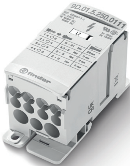
Type 9D.01.5.250.0111 Type 9D.01.5.400.0111