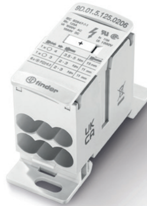
Type 9D.01.5.080.0304 Type 9D.01.5.125.0206 Type 9D.01.5.175.0210