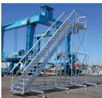
GRANDE HAUTEUR 45°