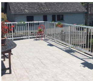
GARDE-CORPS BARREAUDAGES VERTICAUX