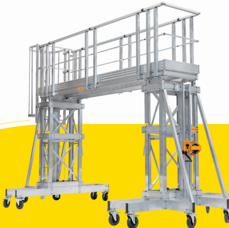
Passerelle réglable en hauteur avec dimensions sur-mesure

UNE SOLUTION À TOUS VOS PROBLÈMES D'ACCÈS