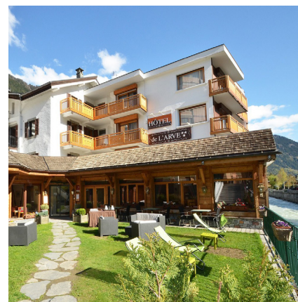
Chamonix 3 étoiles - 37 chambres

Station mythique au coeur des Alpes, Chamonix accueille des touristes toute l'année. L'hiver, l'hôtel de l'Arve offre un hébergement «skis au pied» recherché. La possibilité d'extension de l'hôtel est un atout de Value Add incontestable