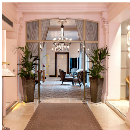
Paris IX 4 étoiles - 77 chambres

Véritable « trophy asset » de 77 chambres abrité dans une voie privée au cœur de Paris. Une thèse d'investissement «Value Add» portée par une montée en gamme ainsi que par un redressement des standard de gestion.