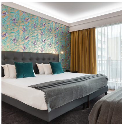
Lyon - Perrache 4 étoiles - 117 chambres

Acquisition en novembre 2019 des murs et du fonds de cet hôtel de la presqu'île de Lyon très bien situé pour les séminaires et loisirs trips. La qualité du sous-jacent immobilier le rends un actif stratégique et prometteur.