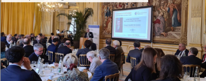
Déjeuner-débat avec François Villeroy de Galhau, Gouverneur de la Banque de France « La politique monétaire peut-elle vaincre l'inflation ? » Vendredi 17 février 2023 - Cercle de l'Union Interalliée

Vous partagez une vision de la finance durable au service du bien commun ?