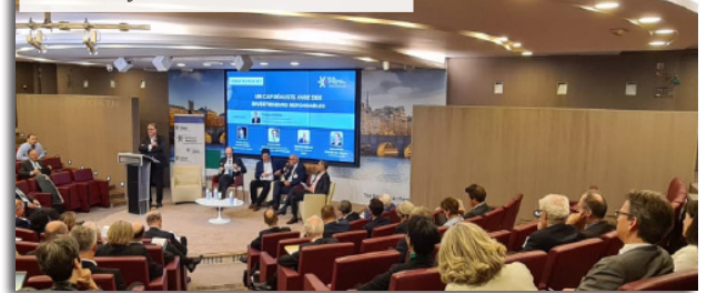
Colloque CILT - Réinventer la retraite Mercredi 8 juin 2022 - BNP Paribas AM

Au sein des Clubs, des groupes de travail et des Forums Mac Mahon, venez contribuer à des travaux de recherche en lien avec l'actualité et les enjeux économiques et financiers de demain.