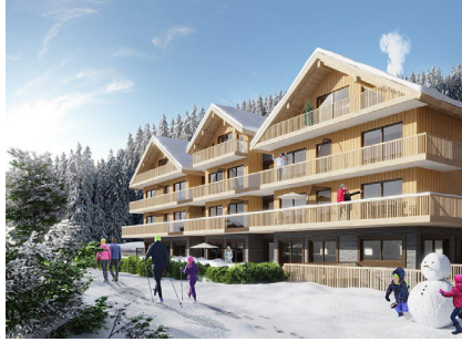
L'Estellan - Arâches-la-Frasse (74)