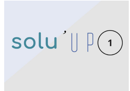
Solu'up 1 - Sotteville-Sous-le-Val (76)

Solution de portage immobilier solidaire