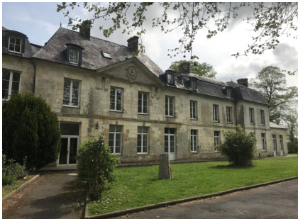
Château de Ravenel - Ravenel (60)