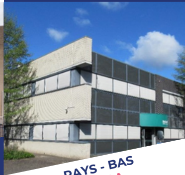
PAYS - BAS BREDA