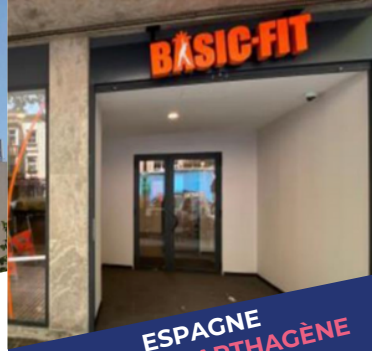
ESPAGNE GIJÓN & CARTHAGÈNE