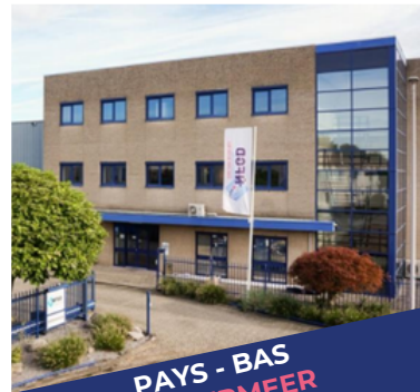
PAYS - BAS ZOETERMEER