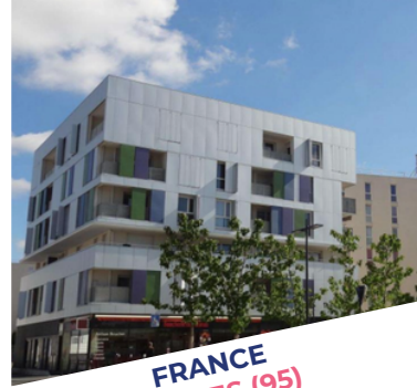
FRANCE FOSSEZ (95)

• UNE PERFORMANCE ATTRACTIVE ET RÉSILIENTE