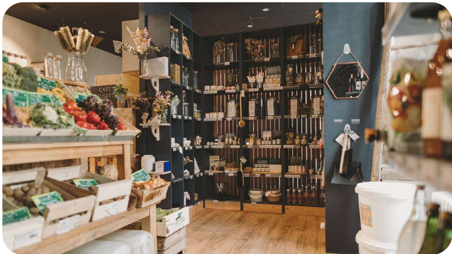
EPICERIE AVEC COIN DROGUERIE