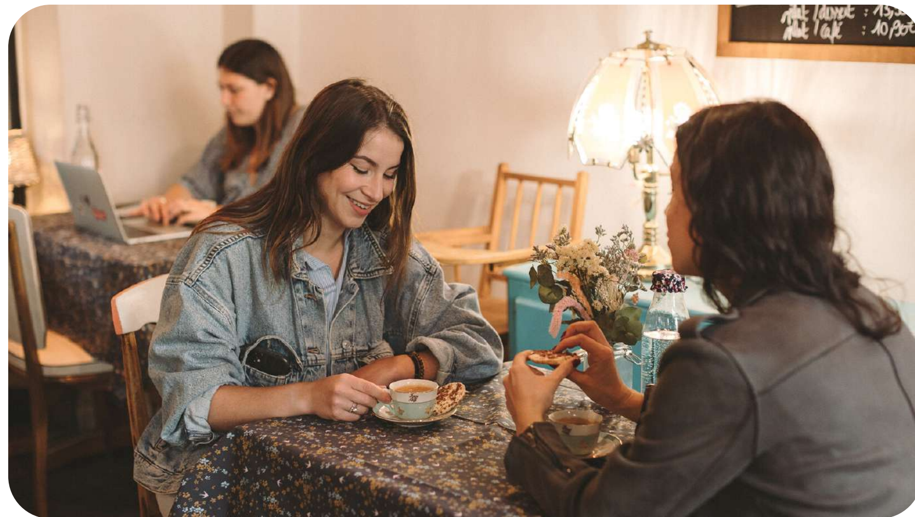
CAFE CAUSETTE : SALON DE THE CHALEUREUX