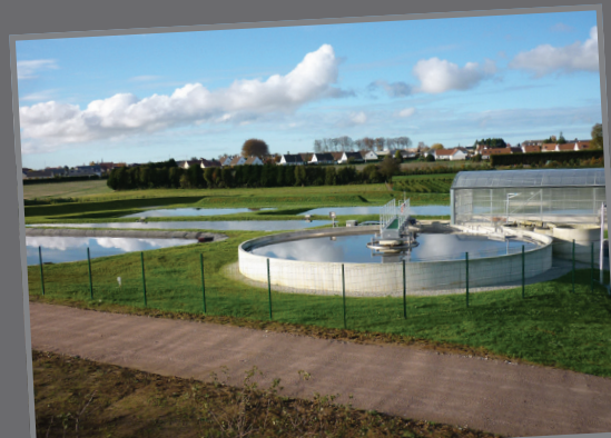
Station d'épuration (3 500 EqH)

Avec l'obtention du label AquaPlus en 2005, PINTO assoit sa compétence parmi les acteurs de la filière eau et environnement en s'engageant sur les valeurs communes de qualité, de sécurité et de développement durable.