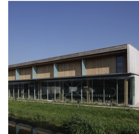
Usine de traitement de l'eau potable (35 100 m³/j)