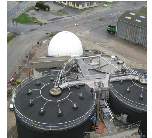
Digesteurs (1 500 m³)