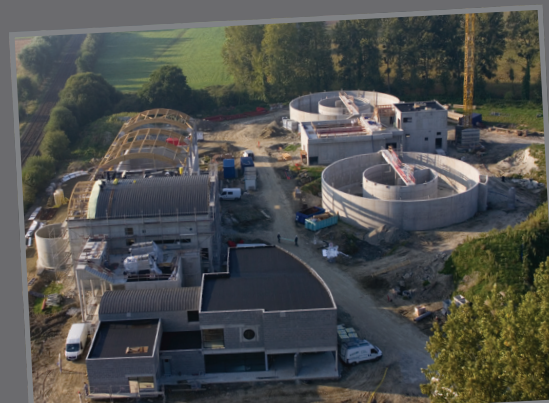
Station d'épuration (40 000 EqH)