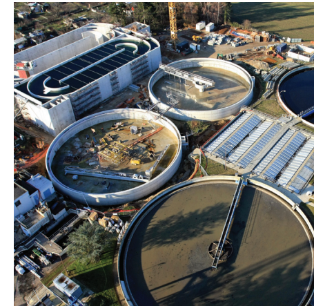
Station d'épuration (150 000 EqH)