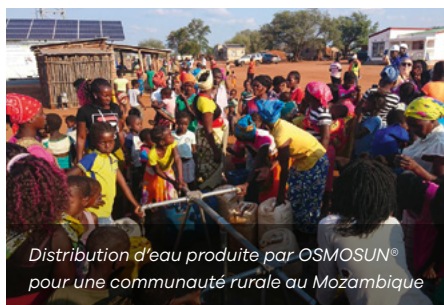
Distribution d'eau produite par OSMOSUN® pour une communauté rurale au Mozambique