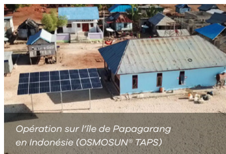
Opération sur l'île de Papagarang en Indonésie (OSMOSUN® TAPS)