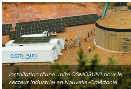
Installation d'une unité OSMOSUN® pour le secteur industriel en Nouvelle-Calédonie