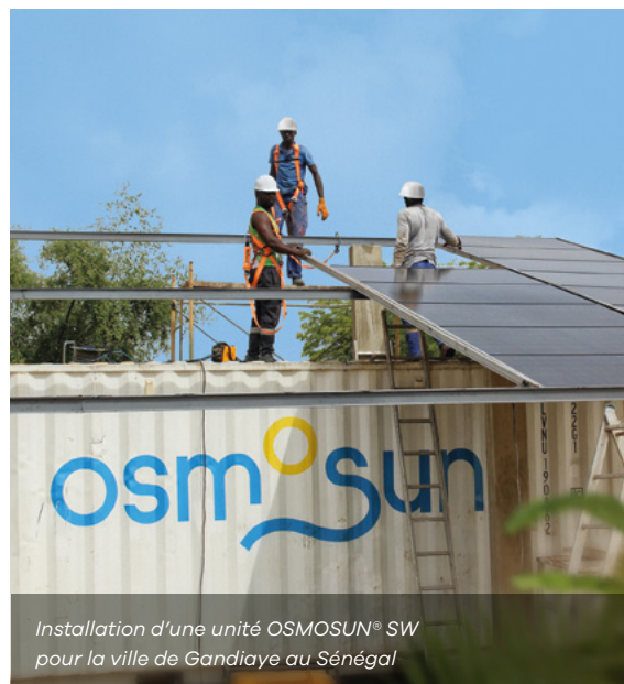
Installation d'une unité OSMOSUN® SW pour la ville de Gandiaye au Sénégal