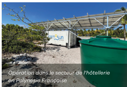
Opération dans le secteur de l'hôtellerie en Polynésie Française

Nous œuvrons dans plus de 30 pays à travers le monde, répartis sur 4 continents. Nous sommes présents en Afrique, Amérique Latine et Caraïbes, au Moyen-Orient et en Asie-Pacifique.