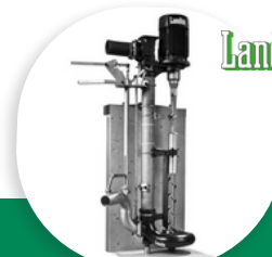
MPG-I POMPE DE RECIRCULATION POUR PRÉPARATION DE MATIÈRE