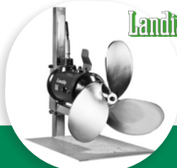
POP-I MÉLANGEUR IMMERGÉ