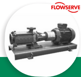
FP POMPE HAUTE PRESSION