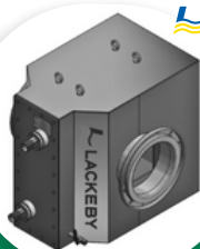
HAW ÉCHANGEUR THERMIQUE AIR/EAU