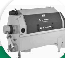
RSS TROMEL MATIÈRE DE VIDANGE