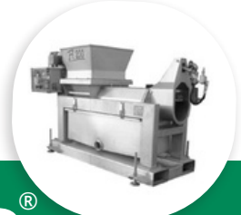
PC PRESSE CONTINUE À VIS