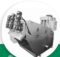
MDS PRESSE À DISQUES