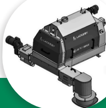
TAMIS ROTATIF AVEC COMPACTEUR À VIS INTÉGRÉ