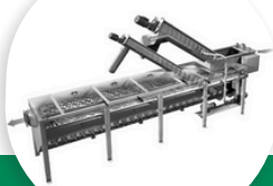
UNITÉ DE PRÉTRAITEMENT COMPACTE