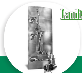
GASMIX AGITATION EXTERNE POUR DIGESTEUR