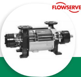
LPHX POMPE À VIDE