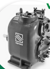
ST-R & J POMPE AUTO-AMORÇANTE