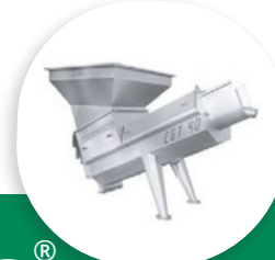
EGT ÉGOUTTOIR CONTINU