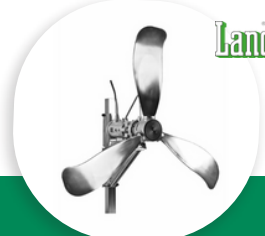
POP-L MÉLANGEUR IMMERGÉ