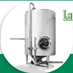
EC'EAU BIOCHOP HYGIENISATEUR