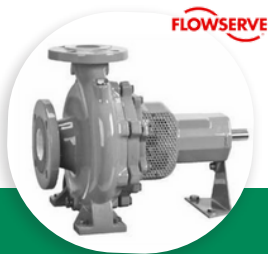
MEN POMPE CENTRIFUGE NORMALISÉE