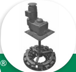
EC'EAU BSK AÉRATEUR LENT DE SURFACE