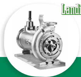
DGR-I POMPE IMMERGÉE DILACÉRATRICE