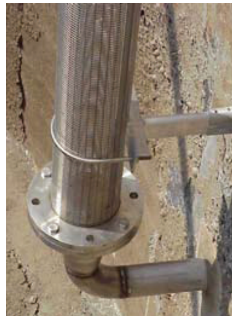
Crépine Johnson Screens