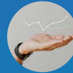
AMÉLIORATION DE LA PERFORMANCE