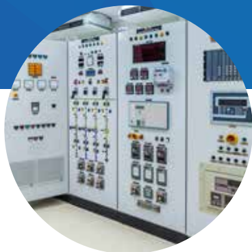
ÉLECTRICITÉ INDUSTRIELLE HT/BT