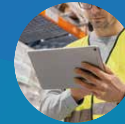
EXTENSION DES FONCTIONNALITÉS