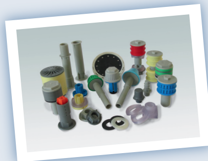
Buselures Crépines Douilles

Une large gamme d'équipement interne aux ouvrages de filtration :