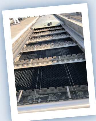
Lamelles de décantation et de tranquillisation, poutraison et goulottes