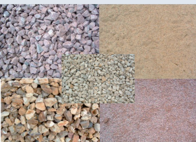
Sable et gravier NF EN 12904

Une sélection de MEDIA pour la filtration, la désodorisation, aération et autres applications spécifiques, entre autres :