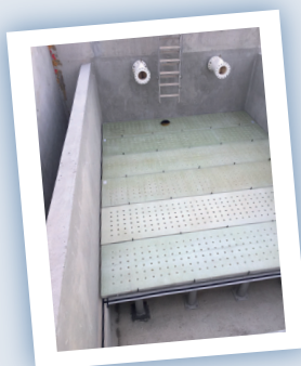
Planchers filtrants : dalles béton ou composite