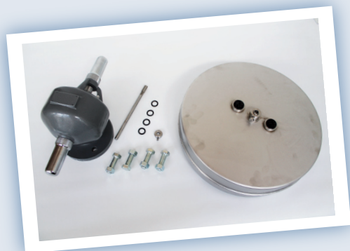
Boîte de partialisation DE 25 / 40