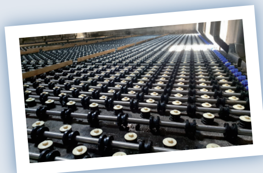
Rampes d'aérations Buselures spécifiques - Raccords et membranes