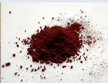
GEH oxy-hydroxyde de fer