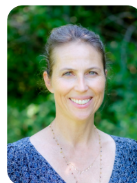
Florence Projet logiciel