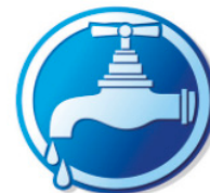
Usines de potabilisation