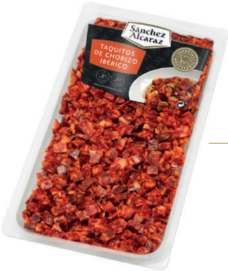
TAQUITOS DE CHORIZO IBÉRICO 300 g Envasado en atmósfera