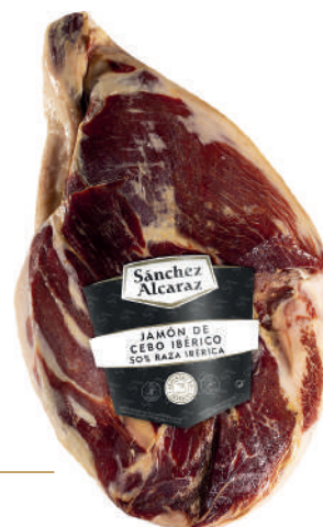
JAMÓN DE CERO IBÉRICO 50% RAZA IBÉRICA Pelado y pulido. De 4 a 6 kg