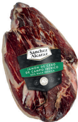
JAMÓN DE CEBO DE CAMPO IBÉRICO 50% RAZA IBÉRICA Pelado y pulido. De 4 a 6 kg