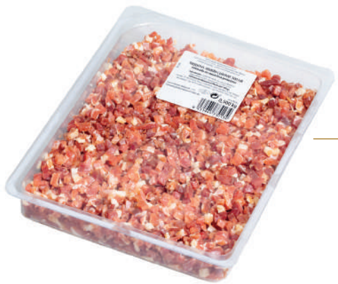
TAQUITOS DE JAMÓN CURADO 500 g Envasado en atmósfera