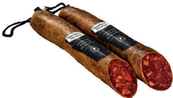
CHORIZO IBÉRICO DE BELLOTA 1 Pieza de 1,2 kg a 1,6 kg Disponible en mitades