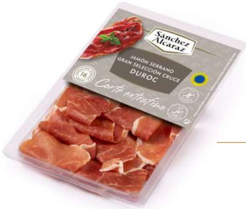
JAMÓN SERRANO GRAN SELECCIÓN CRUCE DUROC 90 g Envasado en atmósfera