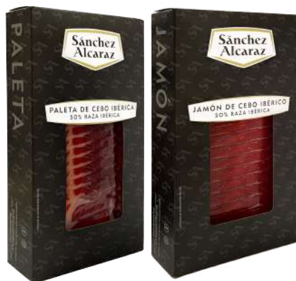
JAMÓN DE CEBO IBÉRICO O PALETA DE CEBO IBÉRICA 50% RAZA IBÉRICA 300 g (5 loncheados x 60 g)