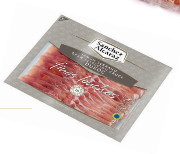
JAMÓN SERRANO GRAN SELECCIÓN CRUCE DUROC 100 g Envasado en atmósfera