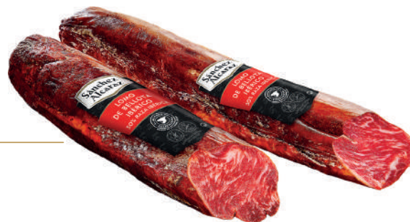
LOMO DE BELLOTA IBÉRICO 50% RAZA IBÉRICA 1 Pieza de 1,2 kg a 1,8 kg Disponible en mitades y tercios