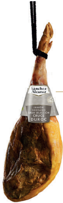
JAMÓN SERRANO GRAN SELECCIÓN CRUCE DUROC CURACIÓN + 15 MESES De 7 a 9 kg