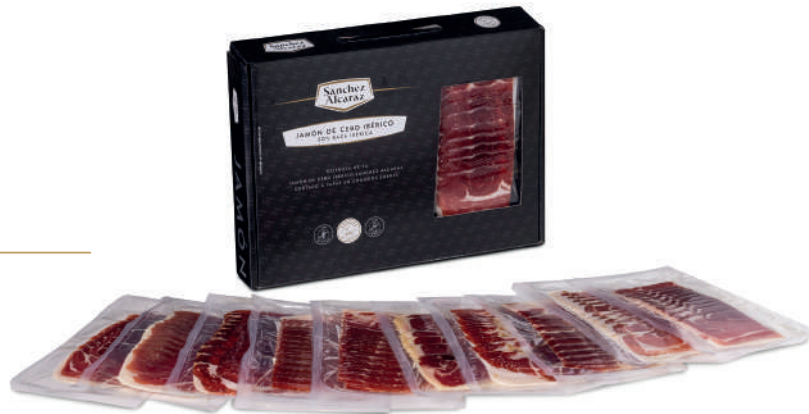
JAMÓN DE CEBO IBÉRICO O PALETA DE CEBO IBÉRICA 50% RAZA IBÉRICA 720 g (12 loncheados x 60 g)