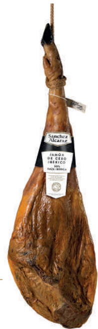
JAMÓN DE CEBO IBÉRICO 50% RAZA IBÉRICA De 7 a 9 kg