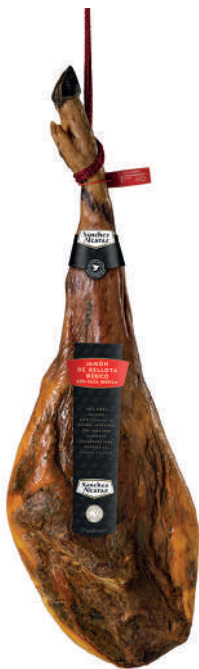
JAMÓN DE BELLOTA IBÉRICO 50% RAZA IBÉRICA De 7 a 9 kg