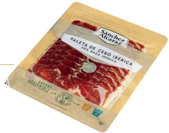
PALETA DE CEBO IBÉRICO 50% RAZA IBÉRICA 100 g Envasado al vacío