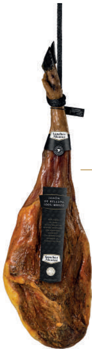
JAMÓN DE BELLOTA 100% IBÉRICO De 5,75 a 8,5 kg