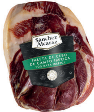
PALETA DE CEBO DE CAMPO IBÉRICA 50% RAZA IBÉRICA Pelada y pulida. De 2 a 4,5 kg