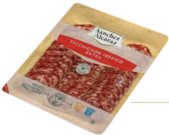
SALCHICHÓN IBÉRICO EXTRA 100 g Envasado al vacío