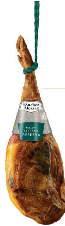
JAMÓN SERRANO RESERVA CURACIÓN + 12 MESES De 6 a 7,5 kg