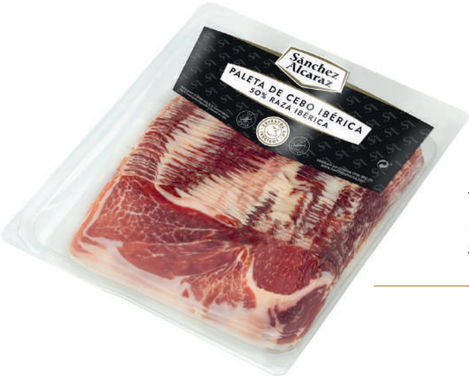
JAMÓN DE CEBO IBÉRICO PALETA DE CEBO IBÉRICA 50% RAZA IBÉRICA 500 g Envasado en atmósfera