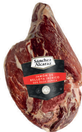
JAMÓN DE BELLOTA IBÉRICO 50% RAZA IBÉRICA Pelado y pulido. De 4 a 6 kg