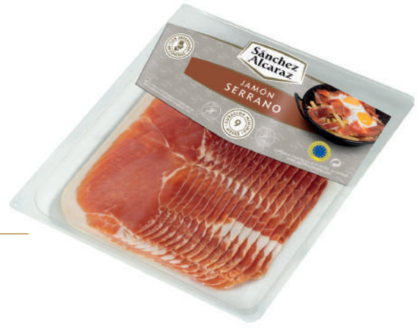
JAMÓN SERRANO 250 g/500 g Envasado en atmósfera