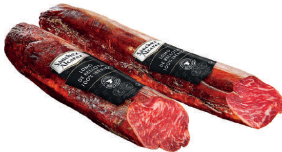
LOMO DE BELLOTA 100% IBÉRICO 1 Pieza de 1,2 kg a 1,8 kg Disponible en mitades y tercios