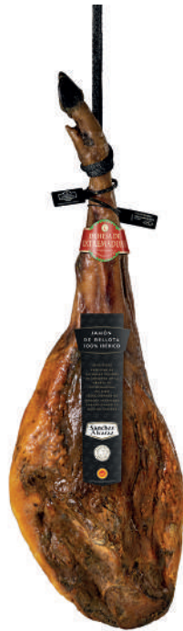
JAMÓN DE BELLOTA DOP EXTREMADURA 100% IBÉRICO De 5,75 a 8,5 kg