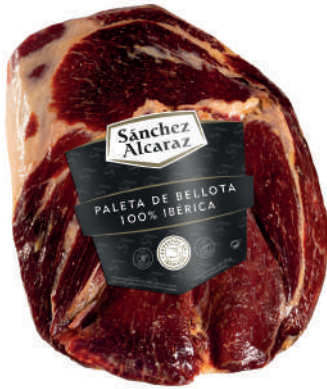
PALETA DE BELLOTA 100% RAZA IBÉRICA Pelada y pulida. De 2 a 4,5 kg