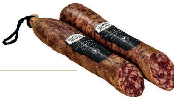
SALCHICHÓN IBÉRICO DE BELLOTA 1 Pieza de 1,2 kg a 1,6 kg Disponible en mitades