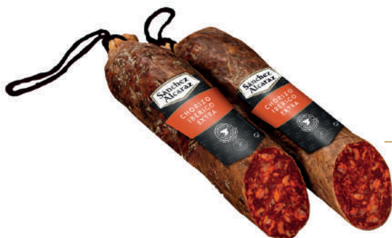
CHORIZO IBÉRICO EXTRA 1 Pieza de 1,2 kg a 1,4 kg Disponible en mitades