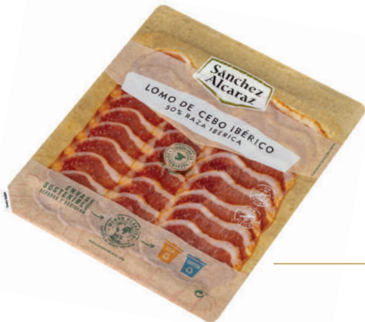
LOMO DE CEBO IBÉRICO 50% RAZA IBÉRICA 100 g Envasado al vacío