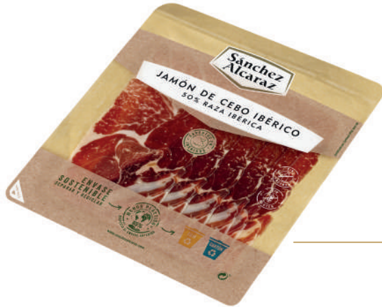
JAMÓN DE CEBO IBÉRICO 50% RAZA IBÉRICA 100 g Envasado al vacío