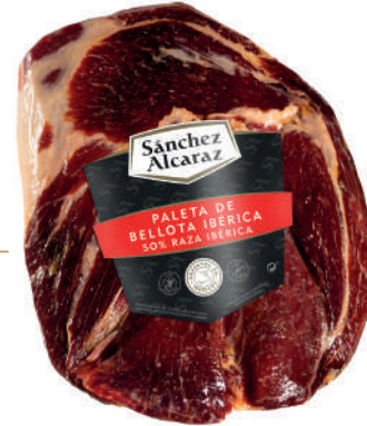
PALETA DE BELLOTA IBÉRICA 50% RAZA IBÉRICA Pelada y pulida. De 2 a 4,5 kg