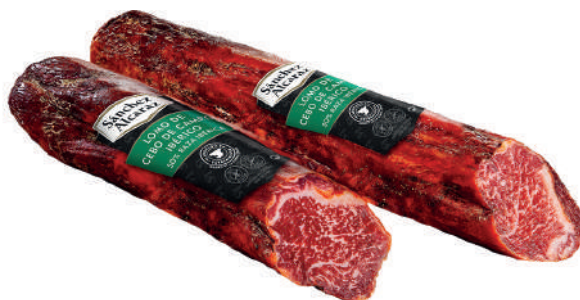
LOMO DE CEBO DE CAMPO IBÉRICO 50% RAZA IBÉRICA 1 Pieza de 1,2 kg a 1,8 kg Disponible en mitades y tercios