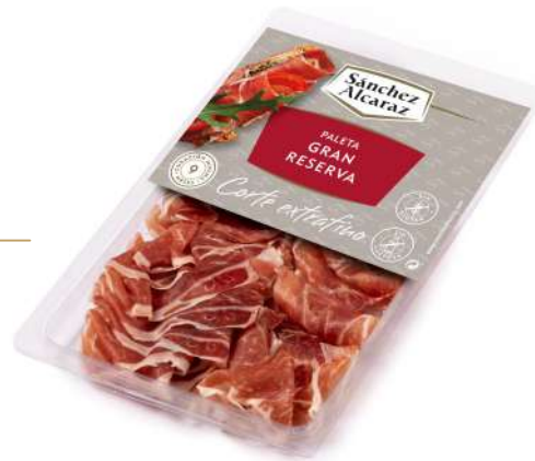
PALETA GRAN RESERVA 90 g Envasado en atmósfera