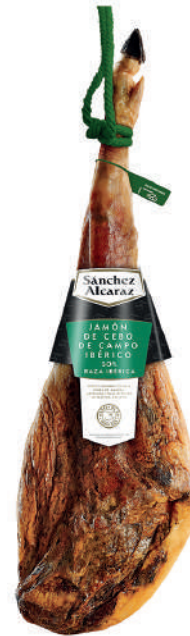
JAMÓN DE CEBO DE CAMPO IBÉRICO 50% RAZA IBÉRICA De 7 a 9 kg