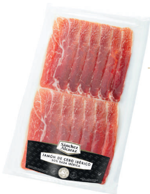
PALETA DE CEBO IBÉRICA 50% RAZA IBÉRICA 150 g / 200 g Envasado al vacío