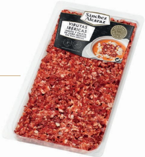
VIRUTAS IBÉRICAS 50% RAZA IBÉRICA 400 g Envasado en atmósfera