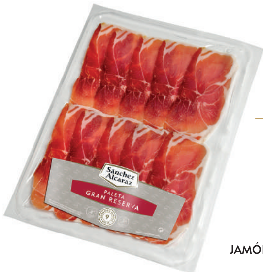
PALETA GRAN RESERVA 120 g Envasado al vacío