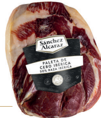
PALETA DE CEBO IBÉRICA 50% RAZA IBÉRICA Pelada y pulida. De 2 a 4,5 kg