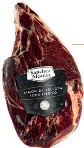
JAMÓN DE BELLOTA 100% RAZA IBÉRICA Pelado y pulido. De 4 a 6 kg