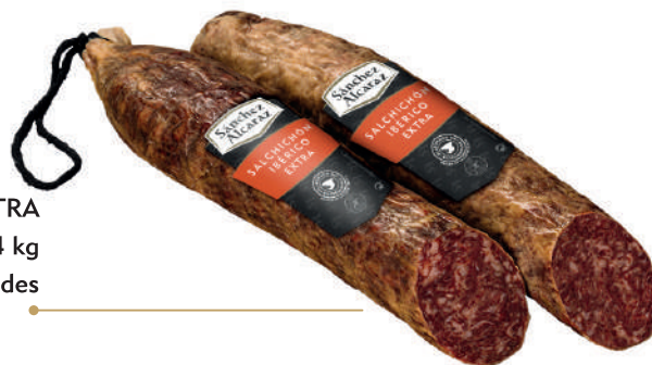
SALCHICHÓN IBÉRICO EXTRA 1 Pieza de 1,2 kg a 1,4 kg Disponible en mitades