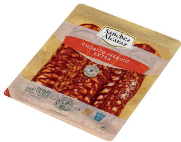
CHORIZO IBÉRICO EXTRA 100 g Envasado al vacío