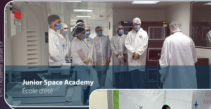
Junior Space Academy École d'été