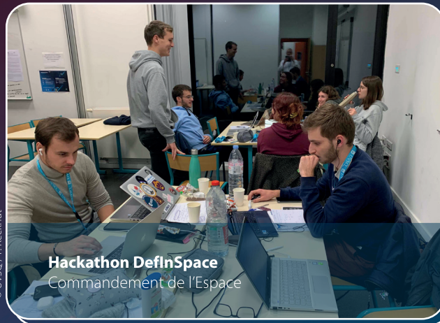
Hackathon DefInSpace Commandement de l'Espace