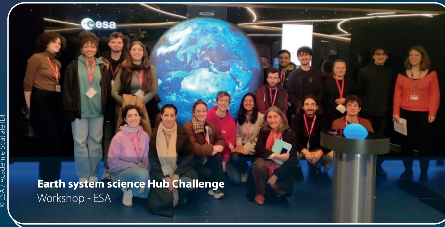
Earth system science Hub Challenge Workshop - ESA