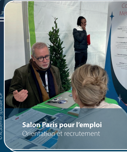
Salon Paris pour l'emploi Orientation et recrutement