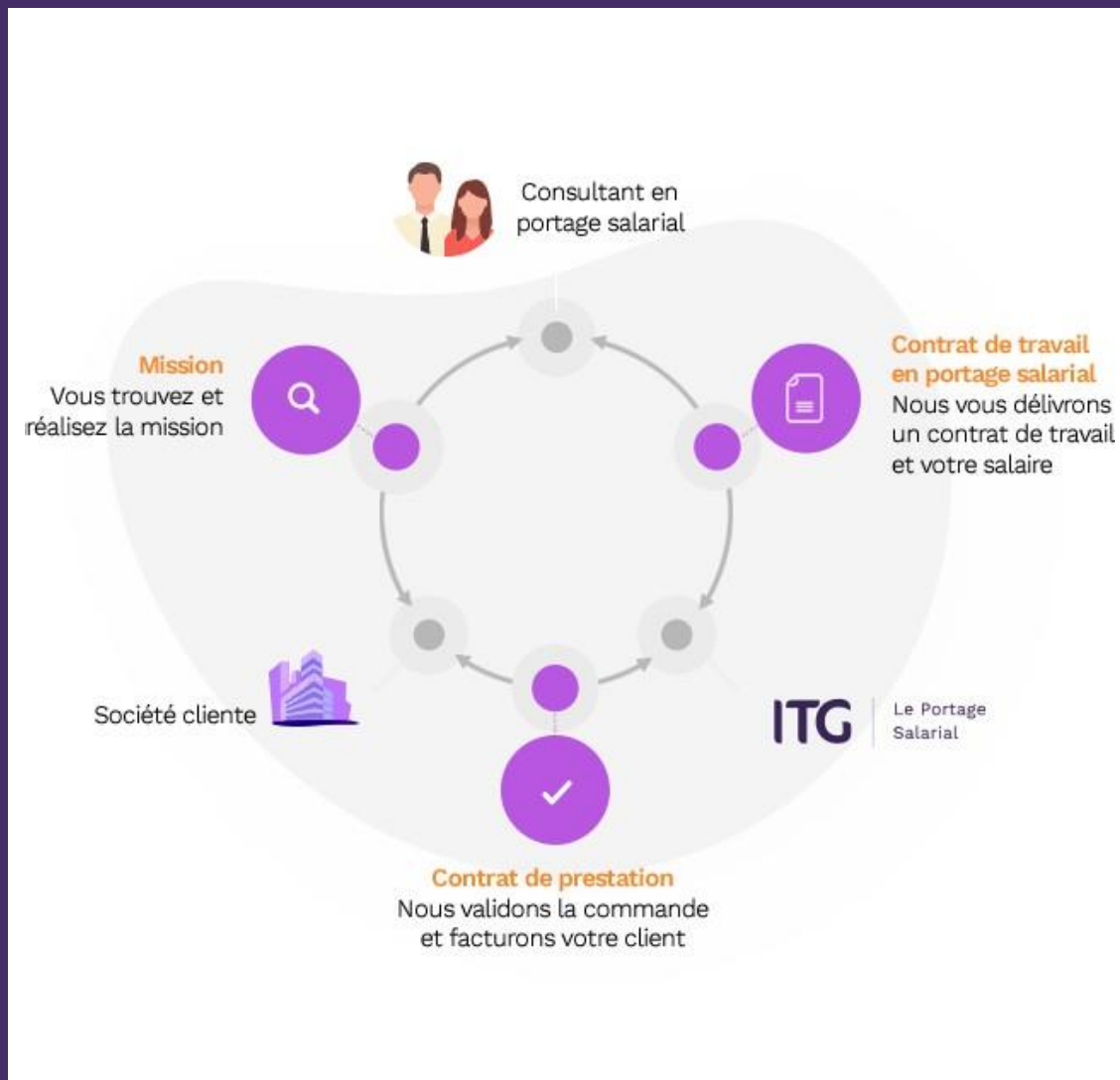
SCHÉMA DE LA RELATION EN PORTAGE SALARIAL