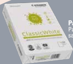
Papier Classic White Papier 100 % recyclé, sans blanchiment

Papier de qualité, labellisé, européenne.