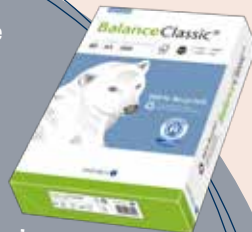
Papier Balance Classic Papier recyclé de qualité, labellisé, fabrication européenne