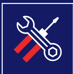
S. A. V

Nos monteurs possèdent une expérience et un savoir-faire leur assurant réactivité et efficacité, quelle que soit la complexité de votre projet. Lors de l'installation de votre équipement, un membre de notre bureau d'études intervient sur le chantier afin de valider les solutions techniques retenues et s'assurer que le montage est bien réalisé selon ce qui a été prévu.