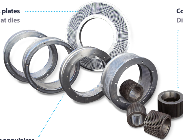
Filières annulaires Ring-shaped dies