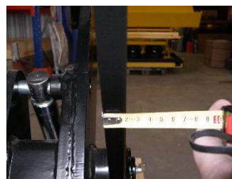
Châssis de construction robuste

Groupe hydraulique intégré dans le volume de la table.