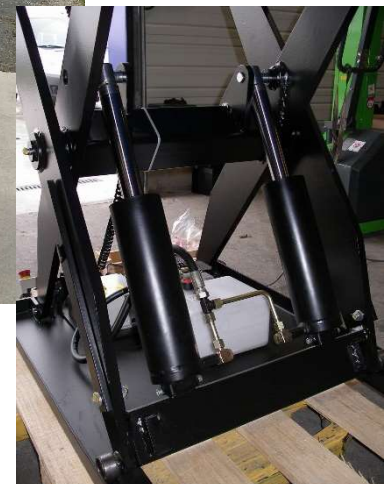
Intégration de 2 vérins sur tous les modèles