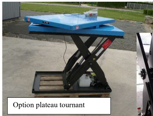
Option plateau tournant