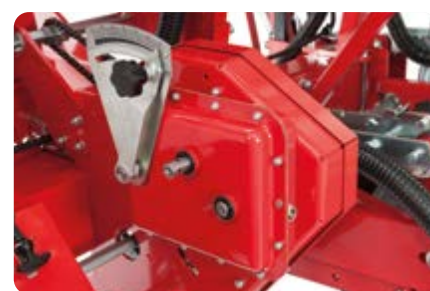
Cambio continuo in bagno d'olio (optional) Oil immersed gearbox (optional) Stufenloses Ölbad-Getriebe (optional) Boîte à bain d'huile (facultatif) Cambio de leva en baño de aceite (opcional)