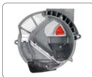
Coperchio distributore dotato di eiettore seme e spazzola che occupa tutta la dimensione del disco di semina

Le distributeur de graines Mascar est le même sois pour les semoirs Maxi que Futura. Les graines contenues dans les réservoirs entrent dans le corps du distributeur où la dépression créée par la turbine permet aux graines d'adhérer aux trous du disque. Le sélecteur en bronze réglable élimine les graines en excès de chaque trou. Lorsque la graine se trouve "à 5 heures", le flux d'air est interrompu et comme il n'y a plus de dépression, il tombe par gravité. Le dispositif de détachement en standard facilite le détachement de la graine du disque. L'objectif des techniciens Mascar était de concevoir un système efficace et précis permettant un accès facile et rapide aux opérations d'entretien. La conformation interne du couvercle a été conçue pour garantir des flux d'air idéaux pour une correcte sélection de la graine et son ultérieur détachement.