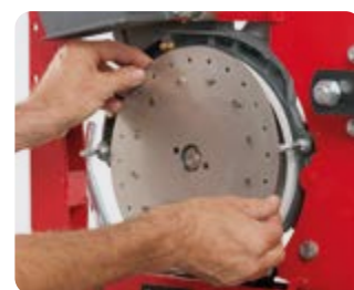
Disco di semina in acciaio inox da 1,2 mm di spessore, resistenti e di facile sostituzione

Tapa del distribuidor dotada de eyector semilla y cepillo que ocupa toda la dimensión del disco de siembra