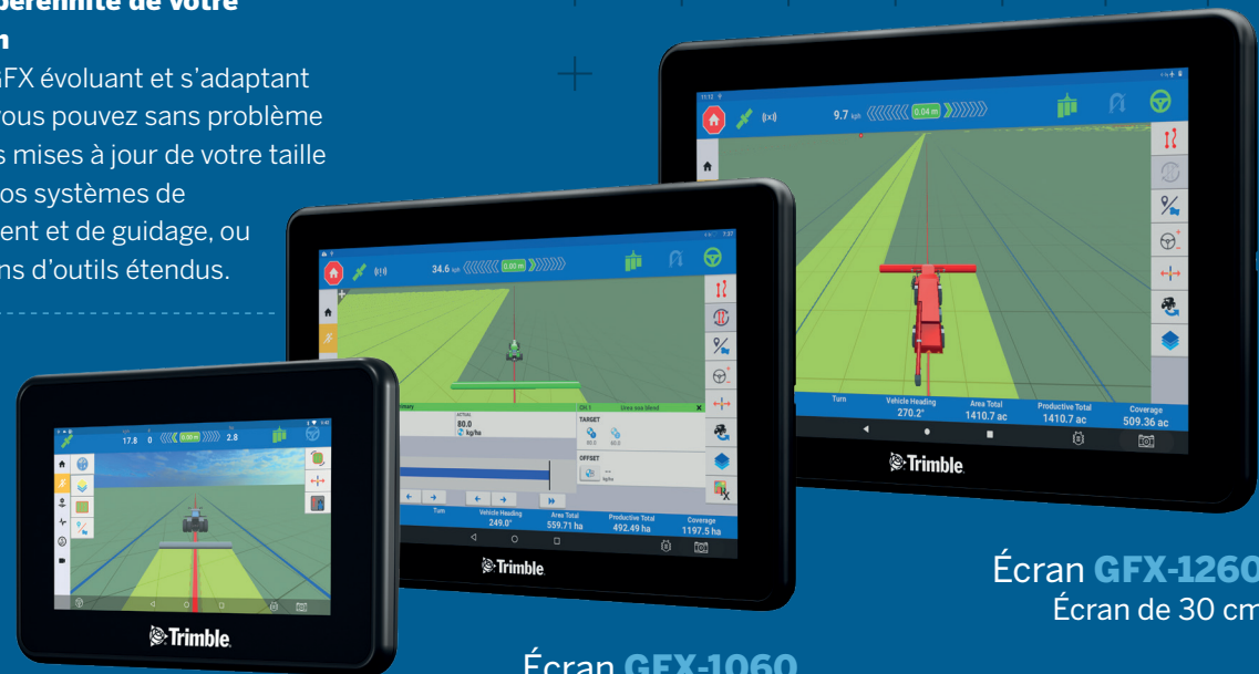
Écran GFX-350 Écran de 17 cm

Les écrans GFX évoluant et s'adaptant facilement, vous pouvez sans problème effectuer des mises à jour de votre taille d'écran, de vos systèmes de positionnement et de guidage, ou de vos besoins d'outils étendus.