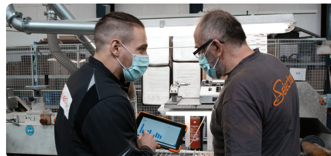
Fabriq chez Selectarc - Mars 2021