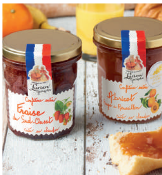
Recettes de fruits