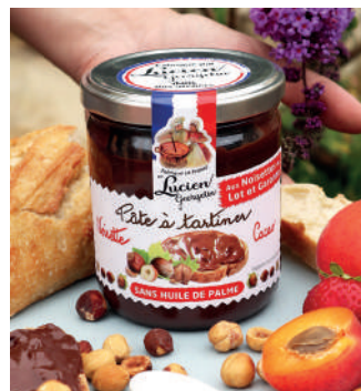
Pâte à tartiner