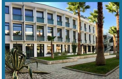
Site de Nice

Notre entreprise est une des rares de cette taille à posséder 3 sites qui couvrent le territoire national.