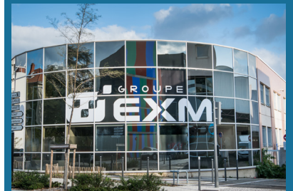
Siège social à Villeurbanne