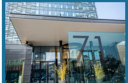
Site de Paris La Défense