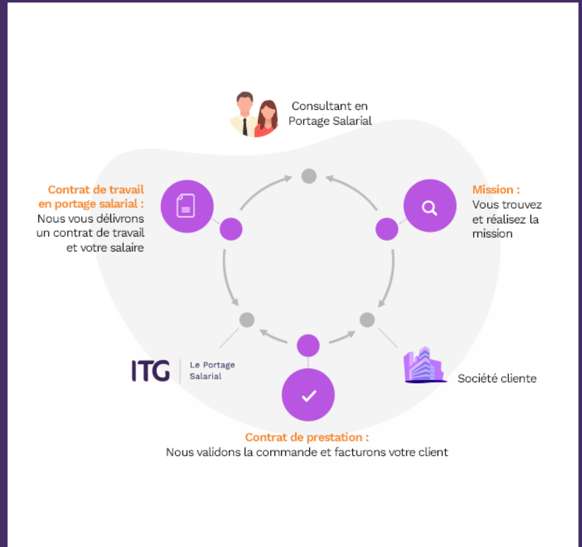
SCHÉMA DE LA RELATION EN PORTAGE SALARIAL