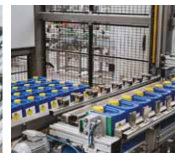
Seaux, jerrycans et fûts