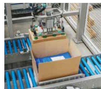
Boîtes et plateaux