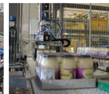
Produits emballés sous film plastique