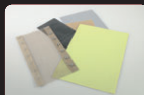
Tissus de verre téflonnés